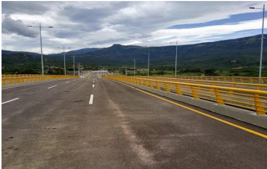
2017年5月撮影 David Chan