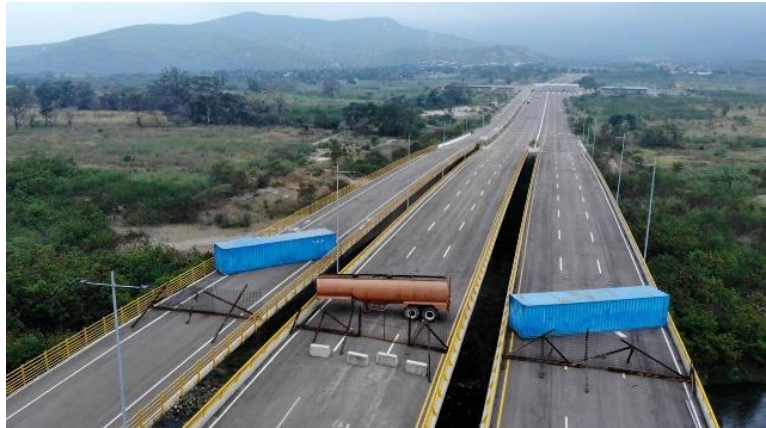
📍 ポイント 1 : 2019 年 2 月