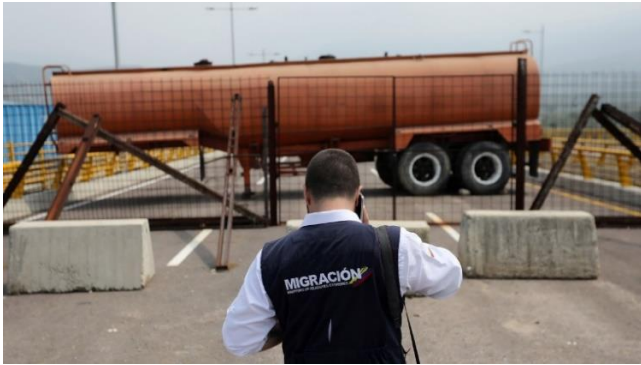
PBS NEWS HOUR 2019 年 2 月 撮影