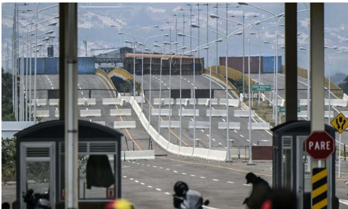
AFP 通信：現地時間2月21日 23日の人道支援行動に対抗するためにマドゥローロ大統領は国境封鎖をさらに強化した。もはや衝突は避けられない雲行き。