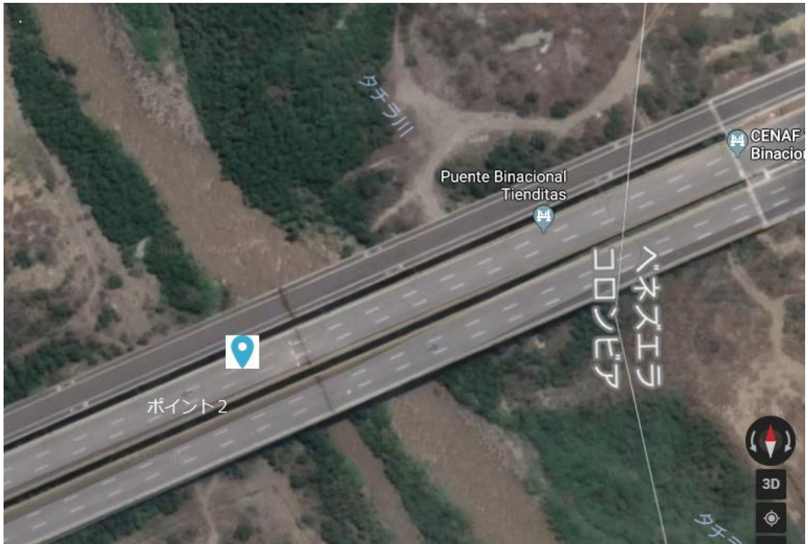
Google Map 2017年頃：コロンビア側が敷設したと思われるフェンスと4個のブロックが見える。