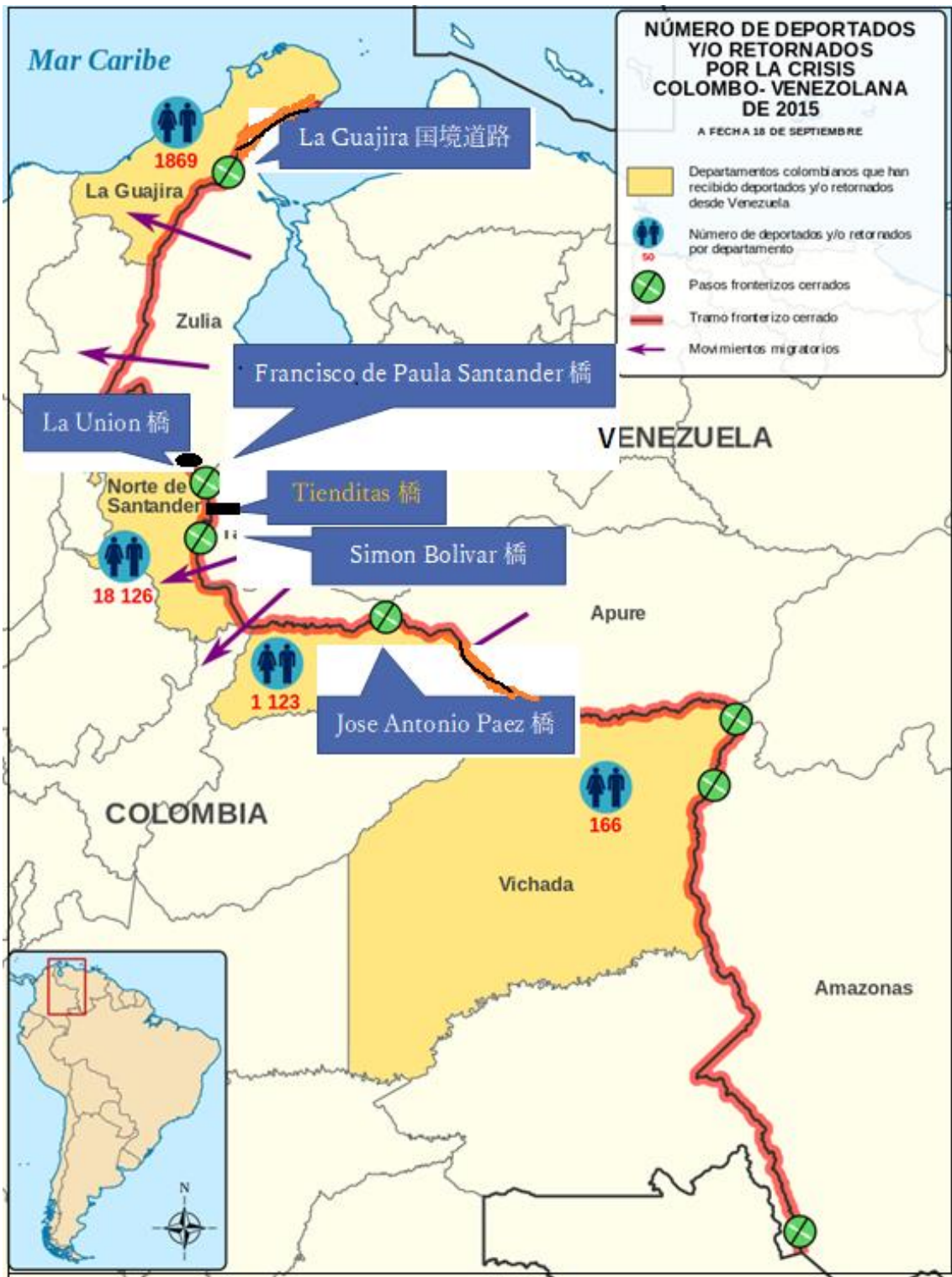
Mapa de la crisis 2015 entre Colombia y Venezuela (deportados-retornados).svg CC BY-SA 4.0