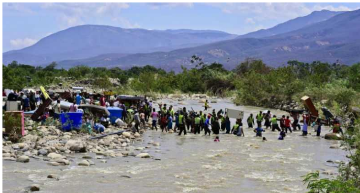
川を渡って越境するベネズエラからの避難民

「最北のマイカオの町からマラカイボに通ずるのがグアヒラ国境道路で、それ以外の5つの国境はみんな川で遮られているので検問のある橋を渡ることになるのよ。もっとも、タチラ川のように平地を流れる川では浅瀬で川幅も狭く、容易に越境が可能なのよ。写真を見てね。橋の場所も図面に入れといたわ」